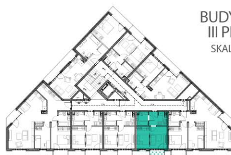
BUDYNEK A III PIĘTRO SKALA 1:100